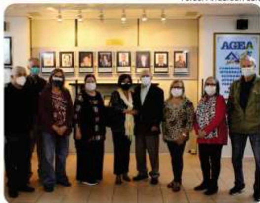
A diretoria da AGEA prestigiou o momento de homenagem.