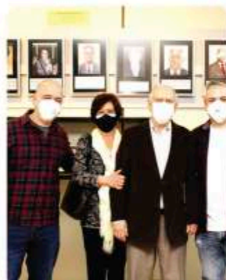
A presença e o apoio da família nesse momento importante